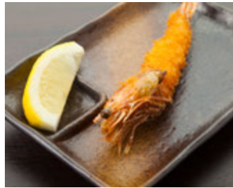
★天使のエビフライ 500円