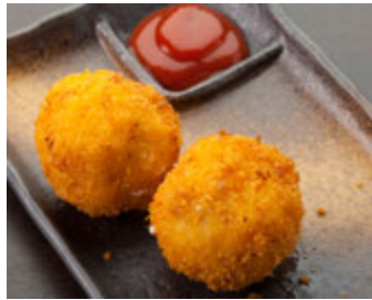
★牛すじコロッケ 500円