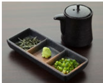
★だし汁茶漬けセット 200円